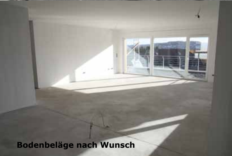
Bodenbeläge nach Wunsch