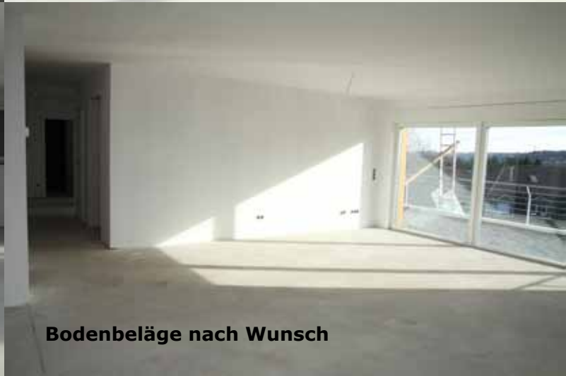
Bodenbeläge nach Wunsch