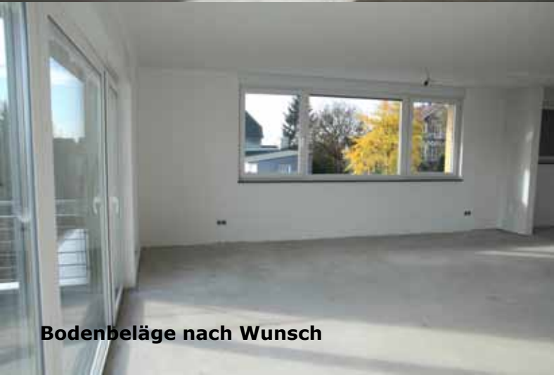
Bodenbeläge nach Wunsch