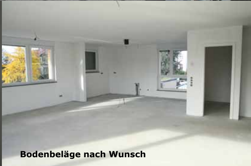
Bodenbeläge nach Wunsch