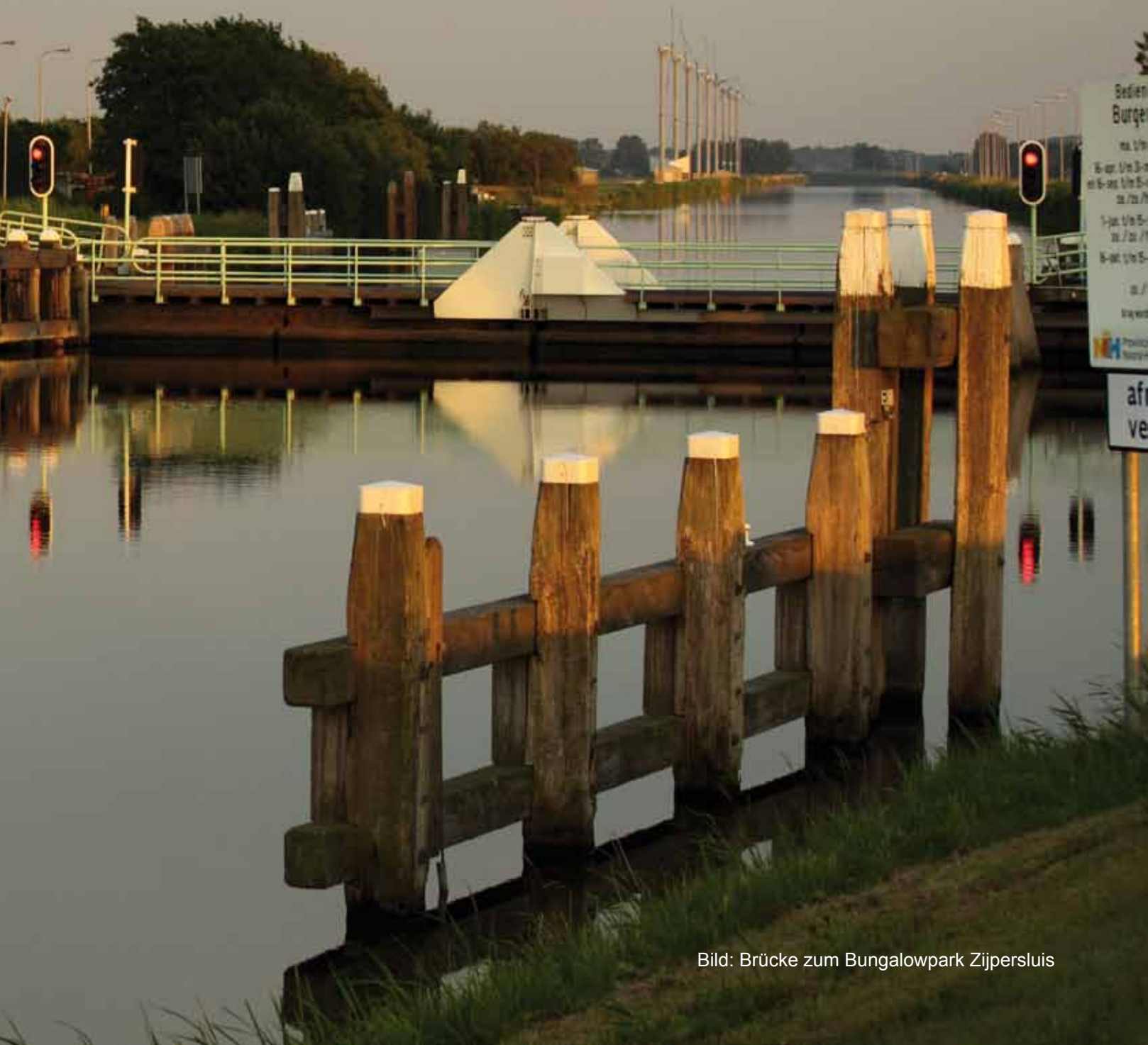
Bild: Brücke zum Bungalowpark Zijpersluis

Im nahe gelegenen Badeort Petten gibt es Einkaufsmöglichkeiten, Restaurants, Tennisplätze und einen Fahrradverleih.