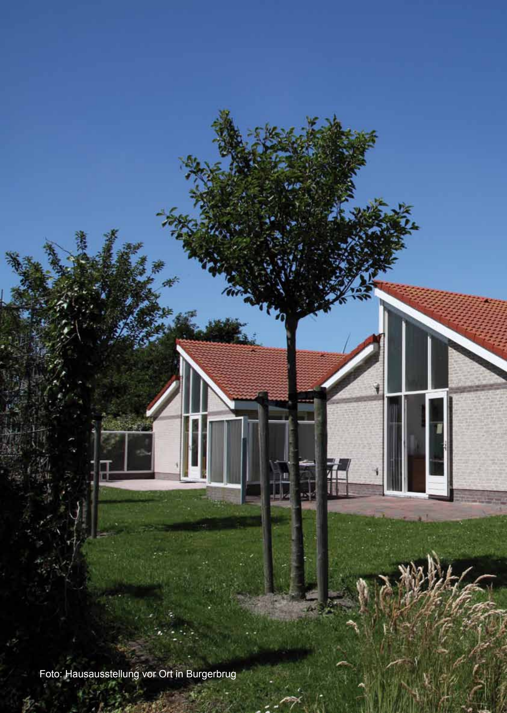
Foto: Hausausstellung vor Ort in Burgerbrug